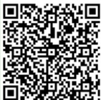
formulaire famille et jeune majeur